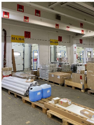
Transport der Produkte zur Abholung der Fahrer

In der Halle 1 sind größtenteils Produkte der Haustechnik gelagert. Dort findet man Sortiment verschiedener Hersteller aus dem Sanitärbereich wie zum Beispiel, Badwannen, WCs, Waschtische, Spülkästen und Zubehör. Produkte aus dem Bereich Heizung werden ebenfalls in der Halle 1 gelagert. Das sind zum Beispiel Ausdehnungsgefäße, Rohrschalen und Durchlauferhitzer.