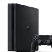
Sony PlayStation 4 Pro 1 TB