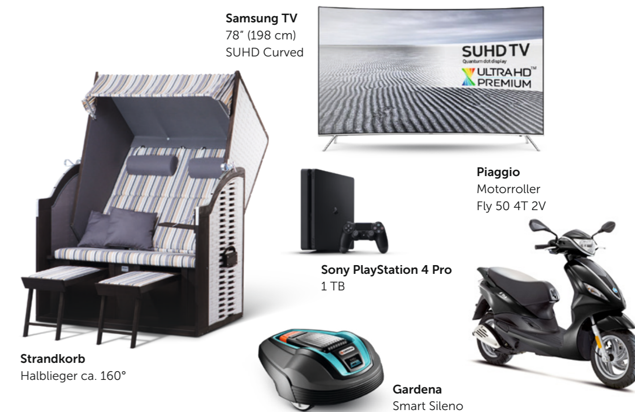
Samsung TV 78" (198 cm) SUHD Curved

Sie haben kräftig Punkte gesammelt? Dann belohnen Sie sich doch dafür. Ihre Punkte können Sie für attraktive Prämien einlösen. Sie möchten mehr für Ihr Unternehmen? Je nach Mitgliedsstatus können Sie zum Beispiel an interessanten Online-Umfragen teilnehmen, werden bei der BRÖTJE Fachhandwerkersuche gelistet, erhalten unseren Newsletter „BRÖTJE Dialog“ und können sogar beim Handwerkerbeirat dabei sein. Viele weitere Vorteile und Prämien warten auf Sie!